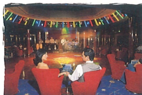
ギャラクシー・オブ・ザ・スターズ ライブ・ミュージック/ダンス・ラウンジ/カクテル (12デッキ)