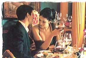
バラツォ イタリア料理 (7デッキ)