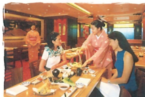
サムライ・レストラン 日本料理レストラン/鉄板焼、寿司、和室 (8デッキ)