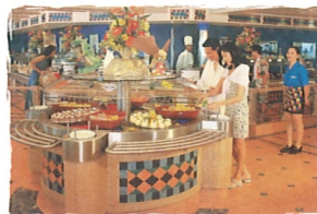
メディテラニアン・ビュッフェ (無料) インターナショナルビュッフェ&テラス (12デッキ)