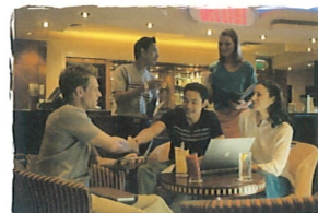
ベリーニ シャンパン・バー (8デッキ)