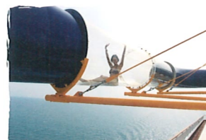
メガ・ウォータースライダー

アクティブに過ごしたいあなたには、プール、ミニゴルフやジムなどのスポーツ施設をご用意しています。またスパやビューティサロン、ジャグジーでゆったりくつろいだり、船上アクティビティに参加するのもよいでしょう。お子様は、めいっばい水と楽しめるネプチューン・ウエット&ワイルドやゲームセンターへどうぞ。