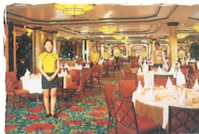
ザ・バビリオン・ルーム (無料) 中華料理 (6デッキ)