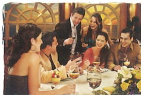
ベラ・ピスタ (無料) インターナショナル・ダイニング (6デッキ)

スーパースター・ヴァーゴには9カ所の国際色あふれるレストランがあり、幅広いバリエーションからの選択が可能です。きっとあなたのお気に入りのダイニングを見つけることができるでしょう。