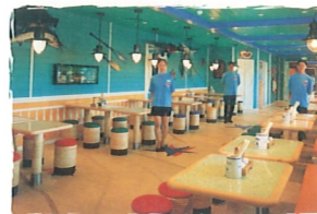
ブルー・ラグーン 東南アジア料理 (7デッキ)