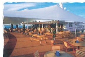
ザ・タベルナ プールサイド・スナック/バー (13デッキ)