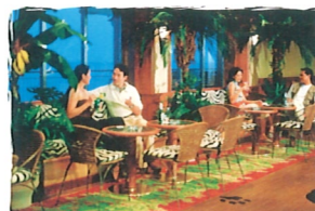
アウト・オブ・アフリカ バブ/カフェ/カラオケボックス(7室)/スロットマシン(7デッキ)