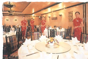
ノーブル・ハウス 中華料理 (7デッキ)