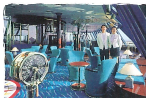
ザ・オブザーバトリー スナック/アフタヌーン・ティー/カクテル (12デッキ)